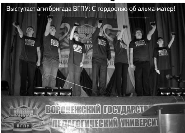
Выступает агитбригада ВГПУ: С гордостью об альма-матер!