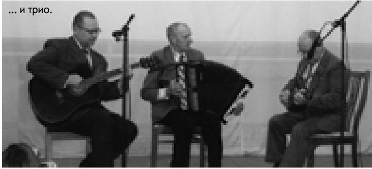
... и трио.

Первое место в смотре поделили учителя Новоусманского лицея, Бабяковской средней школы № 1 и Никольской средней школы. Второе – Трудовской, Тресвятской, Рождественско-Хавской средних школ. Третьими стали педагоги Отрадненской, Новоусманских № 2 и № 3 средних школ.