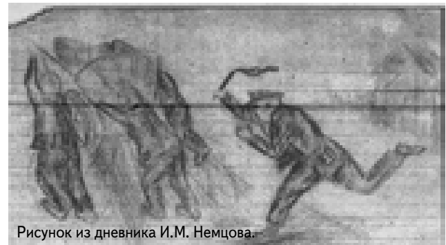
Рисунок из дневника И.М. Немцова.