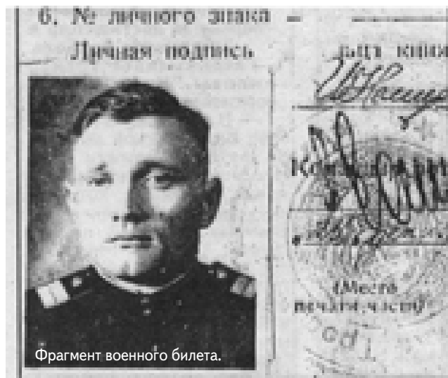
Фрагмент военного билета.