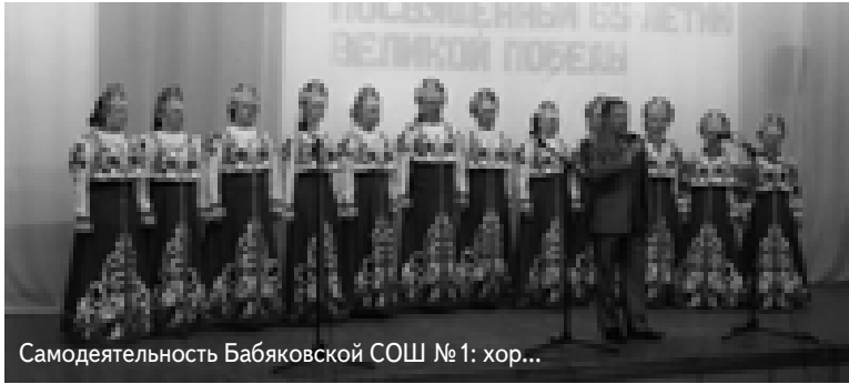
Самодетельность Бабяковской СОШ №1: хор...

В Новоусманском районе прошел большой «Смотр учительских талантов, посвященный 65-летию Великой Победы»