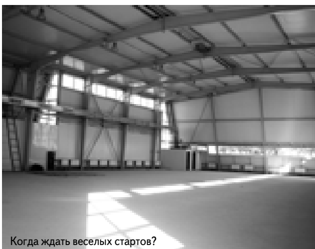
Когда ждать веселых стартов?

но было, что спорткомплекс олигарху был нужен отнюдь не для развития бесплат-