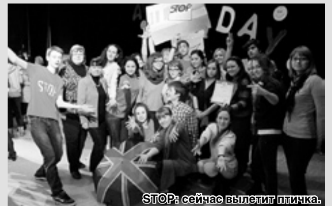
STOP: сейчас вылетит птичка!

Учащиеся гимназии активно участвуют в конкурсах регионального, всероссийского и международного уровня по иностранному языку, становятся победителями и лауреатами. В этом учебном году 6 учеников вторых классов стали победителями регионального этапа Всероссийского конкурса по английскому языку «Британский Бульдог». Учащиеся 10-го профильного класса приняли участие в фестивале школьных театров на английском языке «Эхо Шекспира» в городе Лиски.