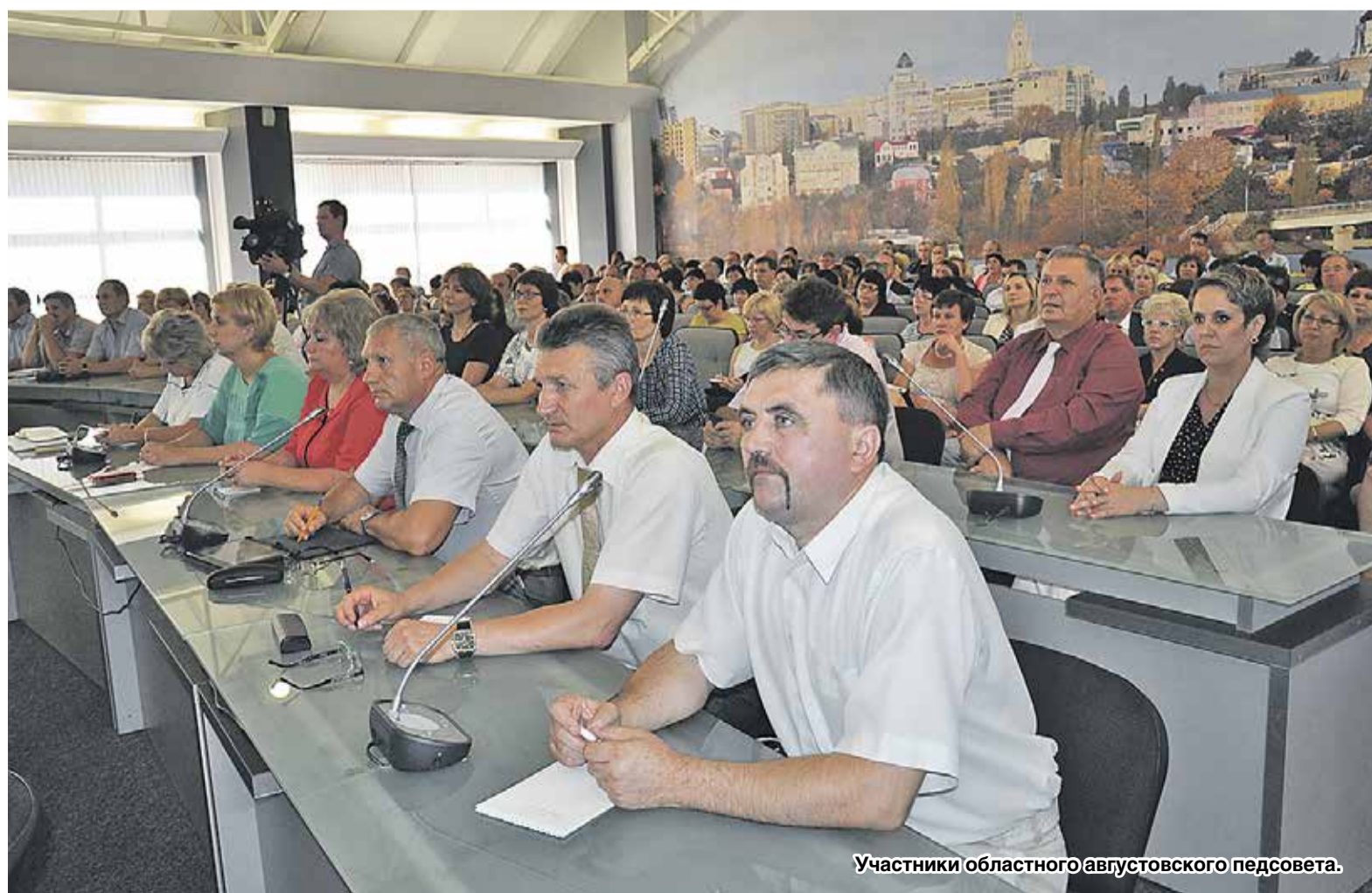
Участники областного августовского педсовета.

Татьяна МАСЛИКОВА, (газета «Мой профсоюз», № 36 от 8 сентября 2016 года).