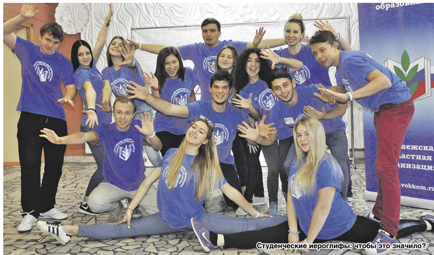
Студенческие иероглифы: чтобы это значило?

В финале мероприятия все команды представили творческие номера, свидетельствующие о том, что ребята по-настоящему сдружились и сплотились за дни учебы. Каждый участник получил массу эмоций, новые знания, новые знакомства, бесценный опыт и, конечно же, сертификат, подтверждающий прохождение «Осенней школы актива-2016».