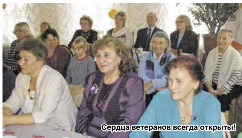
Сердца ветеранов всегда открыты!

Ветераны, на тот момент просто благодарные зрители, получили настоящий заряд бодрости и положительных эмоций! Было видно, как сияли от счастья их глаза. В за-