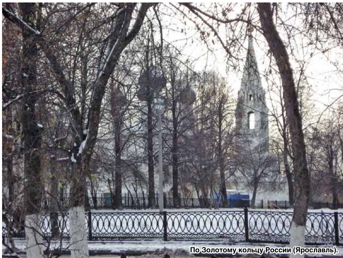
По Золотому кольцу России (Ярославль).

Утренняя Кострома встретила нас легким морозцем и небольшим снежком. Отдохнувшие и веселые после обильного завтрака, отправились знакомиться с