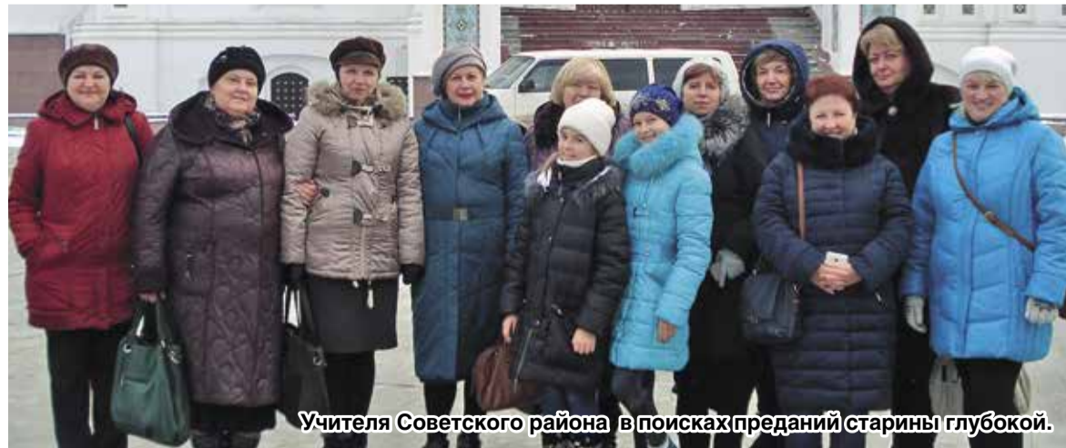
Учителя Советского района в поисках преданий старины глубокой.

Трудно передать словами те чувства, которые до краев переполняли нас. Хочется до земли поклониться тем, кто наперекор всем историческим катаклизмам отстоял и возродил нашу русскую старину. И, конечно, спасибо райкому профсоюза, который подарил нам такую замечательную возможность познакомиться, сблизиться с этой стариной!