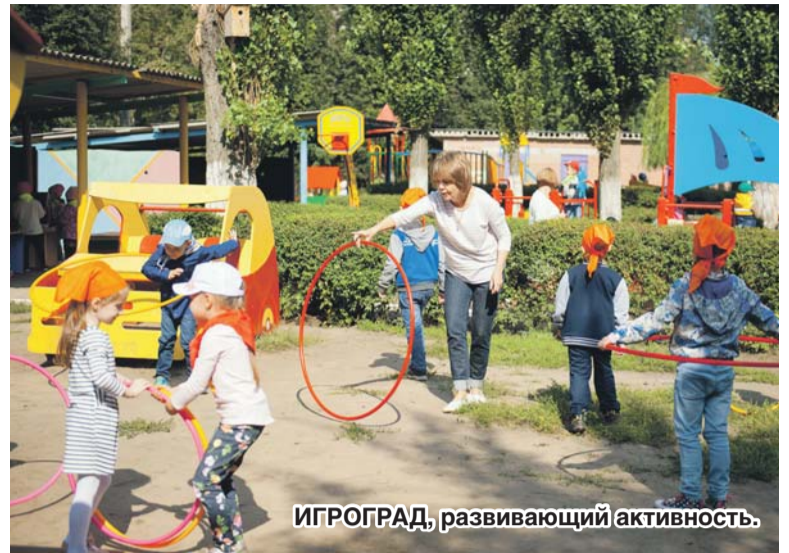
ИГРОГРАД, развивающий активность.