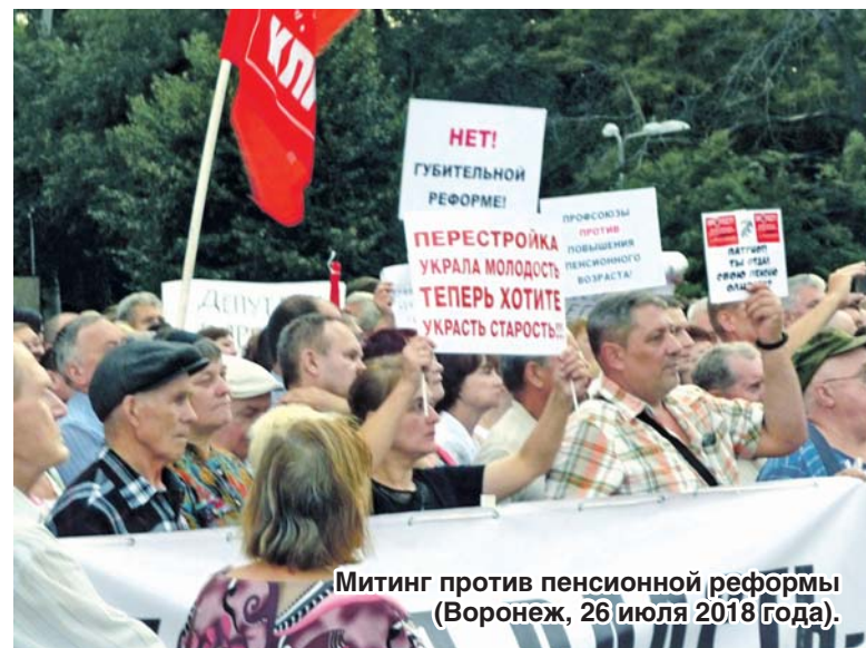
Митинг против пенсионной реформы (Воронеж, 26 июля 2018 года).

Митинг 26 июля у цирка был назначен на 18.00 (с часовой продолжительностью). Фактически он начался несколько раньше. Обычно на акции КПРФ в период «до и после» звучат патриотические музыкальные композиции советского времени. На этот раз было иначе: перед началом митинга из колонок летело выступление депутата (и руководителя фракции КПРФ) Государственной Думы, председателя ЦК КПРФ Геннадия Зюганова 19 июля в ходе первого думского чтения по пенсионной реформе. Как пояснил на митинге Сергей Рудаков, это было сделано потому, что телевидение извратило слова Зюганова: «Мы почему сегодня включили Зюганова? Мы пришли на рынок раздавать газету. А женщина говорит: «А чего это Геннадий Андреевич вроде бы поддерживает пенсионную ре-