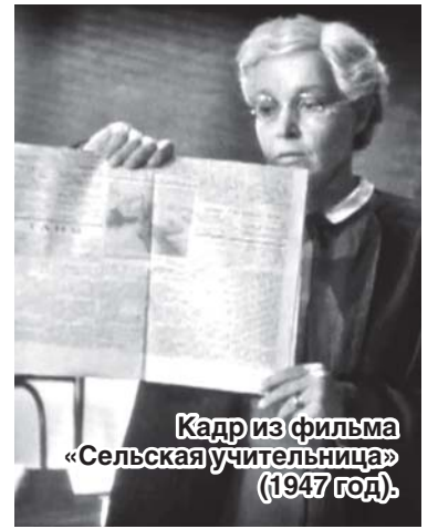
Кадр из фильма «Сельская учительница» (1947 год).

Право на досрочное назначение пенсии лицам, осуществлявшим не менее 25 лет педагогическую деятельность в учреждениях для детей, то есть независимо от возраста, обособывается, кроме того, особенностями их трудовой деятельности, связанной с длительным неблагоприятным воздействием на здоровье работников вредных факторов, обусловленных постоянной повышенной эмоциональной и психологической нагрузкой, которые, как следствие, приводят к утрате либо существенному снижению трудоспособности, к признакам профессионального выгорания...»