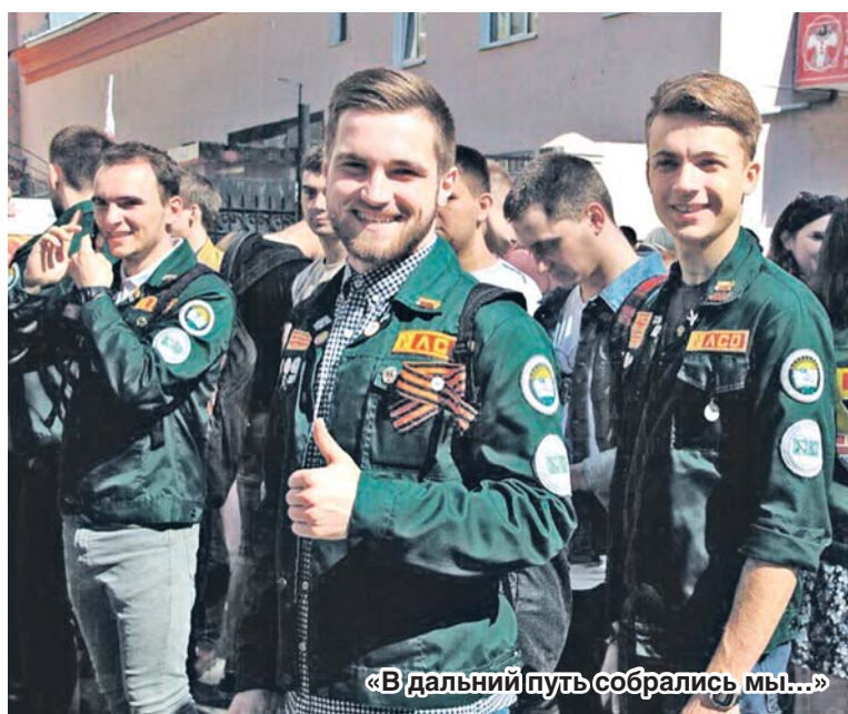
«В дальний путь собрались мы...»

Основной ценностью студенческих отрядов является постоянное повышение бойцами уровня своей профессиональной компетенции. Флагманами развития российских студенческих отрядов являются трудовые проекты. В их рамках сту-