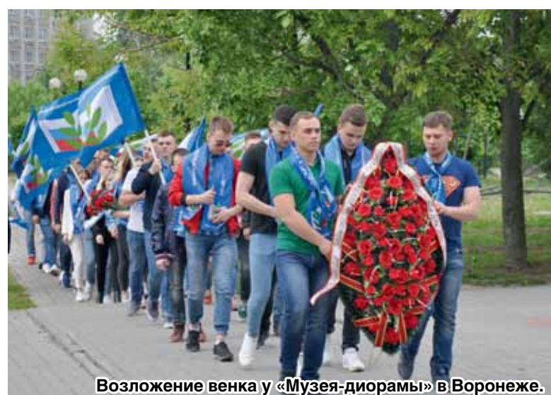
Возложение венка у «Музея-диорамы» в Воронеже.

В половине девятого утра 14 мая все 12 экипажей автопробега уже стояли в Воронеже на Ленинском проспекте, напротив парка Патриотов. Двенадцать автомобилей с представителями основных вузов столицы Черноземья готовы были из Города воинской славы проехать по населенным пунктам воинской доблести. Заметим, что в России первые населенные пункты воинской доблести появились именно в Воронежской области. В год 70-летия Победы (2015-й) на территории первых населенных пунктов, удостоенных этой чести «за мужество, стойкость и массовый героизм, проявленные их защитниками в борьбе за свободу и независимость Отечества», были установлены памятные стелы с изображением герба населенного пункта и текстом соответствующего указа.