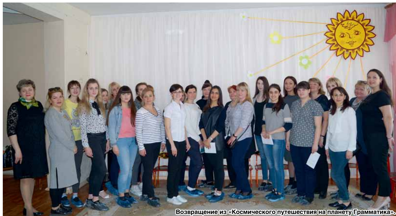
Возвращение из «Космического путешествия на планету Грамматика».

Завершилось все обсуждением и подведением итогов. Анкетирование молодых воспитателей подтвердило важность и нужность таких мероприятий.