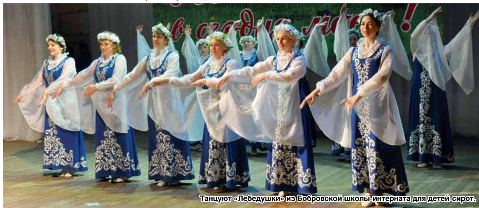
Танцуют «Лебедушки» из Бобровской школы-интерната для детей-сирот.