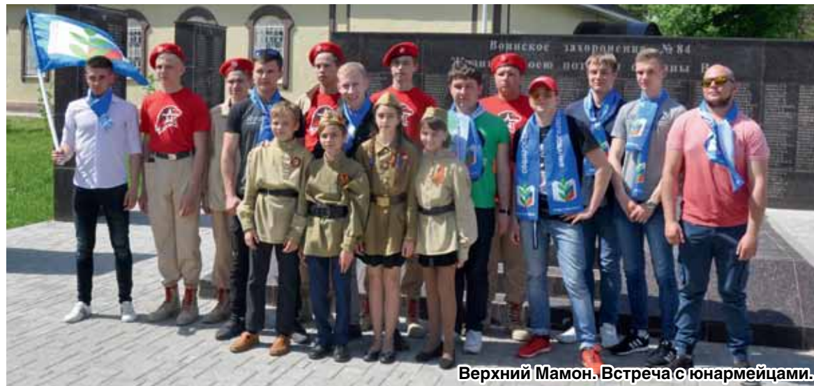
Верхний Мамон. Встреча с юнармейцами.

(Полную версию материала читайте на сайте Vobkom.ru )