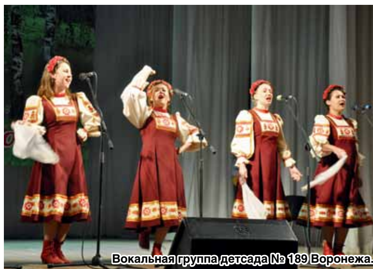
Вокальная группа детского сада № 189 Воронежа.