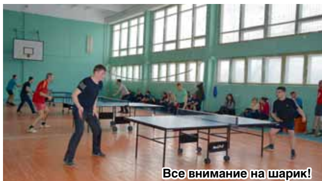
Все внимание на шарик!

Настольный теннис – игра красивая, зрелищная. Больевики не успевали следить за полетом теннисного шарика, а игроки поражали быстрой пространственной ориентировкой, мгновенной реакцией, точностью движений. Но игра в настольный теннис – это не только техника и тактика, это и эмоции, которые испытывает игрок: радость – от удачного удара, огорчение – от проигранного очка. Тем не менее, в каждой партии мне, как организатору турнира, было заметно доброжелательное отношение соревнующихся друг к другу: они не только играли, но и, познакомившись друг с другом, завели новых друзей.