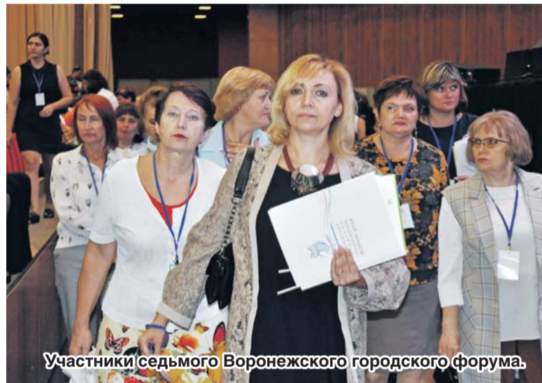
Участники седьмого Воронежского городского форума.

По окончании дискуссии участниками форума был показан концерт российской эстрадной певицы Ларисы Долиной.