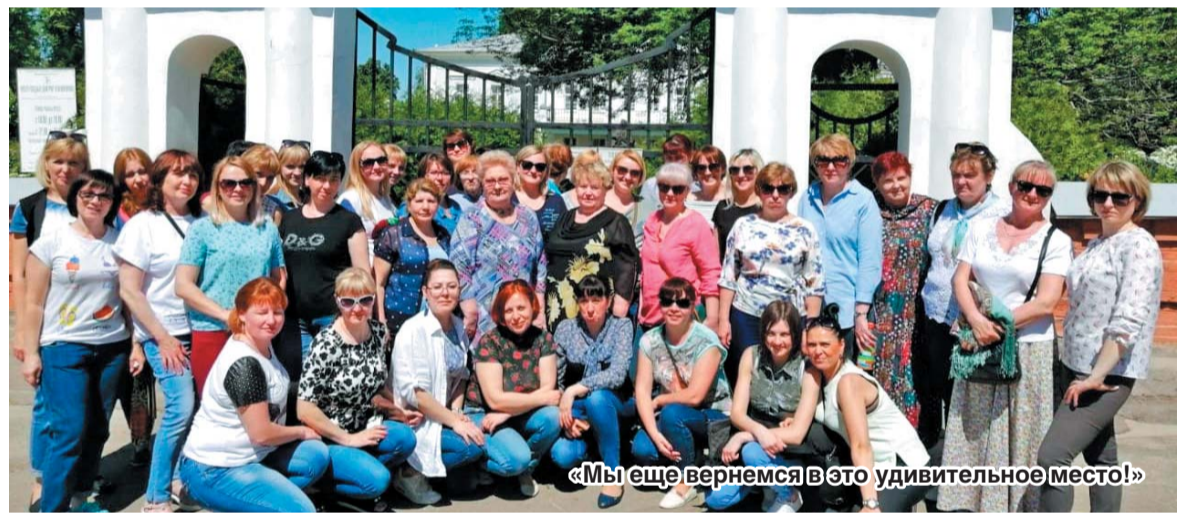
«Мы еще вернемся в это удивительное место!»

Покидали мы музей-усадьбу под большим впечатлением. Напряжение конца учебного года куда-то ушло. Фото на память. Нам уже не забыть картины цветущей сирени, волн ее аромата. Хочется думать, что мы еще вернемся в это удивительное место.