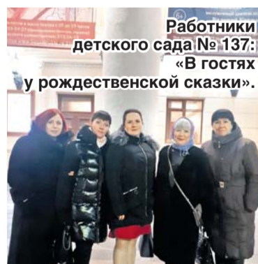
Работники детского сада № 137: «В гостях у рождественской сказки».

Сказочная история никого из нас не оставила равнодушным, и в антракте мы так горячо обсуждали все происшедшее на сцене, что даже забыли про фотосессию... И, выйдя на работу, еще долго делились с коллегами своими впечатлениями о великолепном и ярком балетном спектакле. При нашей напряженной деятельности такие мероприятия очень нужны – они сплачивают коллектив, дают нравственное и духовное развитие.