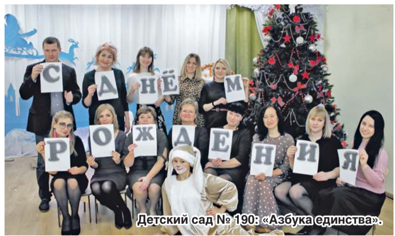
Детский сад № 190: «Азбука единства».

Доброй традицией стало поздравление работников детского сада с профессиональными и календарными праздниками, с юбилейными датами. В такие дни для каждого сотрудника находят теплые слова, подкрепленные материальной помощью.