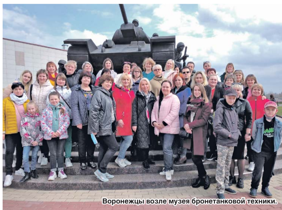
Воронежцы возле музея бронетанковой техники.

Проходят годы, но память о завоевавших Победу навечно в наших сердцах. И мы бесконечно благодарны всем, кто, не жалея себя на поле боя и в тылу, подарил нам возможность жить на нашей земле!