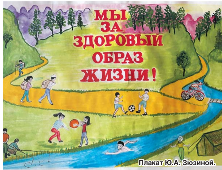
Плакат Ю.А. Зюзиной.

И отзывы из первичных профсоюзных организаций были очень значимыми: подобных творческих состязаний нужно проводить как можно больше. С другой стороны – 2021-й год Исполнительный комитет Общероссийского профсоюза образования объявил Годом