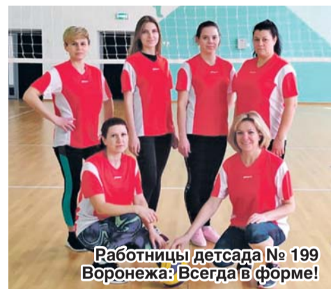
Работницы детсада № 199 Воронежа: Всегда в форме!

Занимаемся мы и дополнительно: вместе бегаем, катаемся на лыжах и велосипедах, играем в волейбол, укрепляем общую физическую форму. Ведь давно известно, что здоровый образ жизни – основа профилактики вирусных и простудных заболеваний. Кроме того, спорт – отличный антистрессовый инструмент. В процессе двигательной активности вырабатываются эндорфины – гормоны счастья, отвечающие за настроение и ощущение внутренней удовлетворенности личной жизнью, работой, окружающим миром.