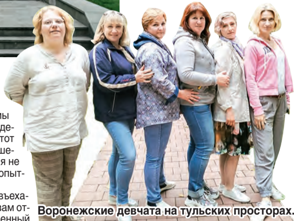
Воронежские девчата на тульских просторах.

тельная экспозиция, все они в совокупности сохраняют композиционное единство, открывающее перед нами сложный и интересный мир старой России. Вместе с экскурсоводом наша группа прошла по гостиной, взглянула в рабочий кабинет и на женскую половину. Мы изучили, как хранились запасы в погребе XIX века, а в настоящей купеческой лавке у нас была возможность купить подарки и сувениры.