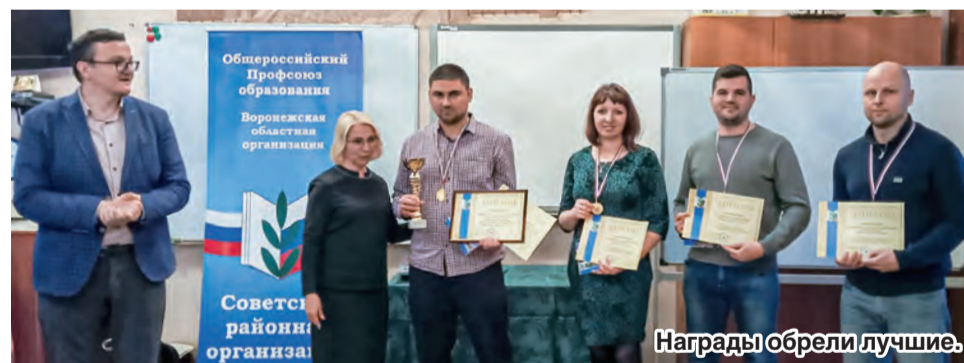
Награды обрели лучшие.

Общее руководство подготовкой и проведением соревнований взяла на себя Советская районная организация Профсоюза. Непосред-