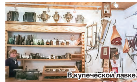
В купеческой лавке.