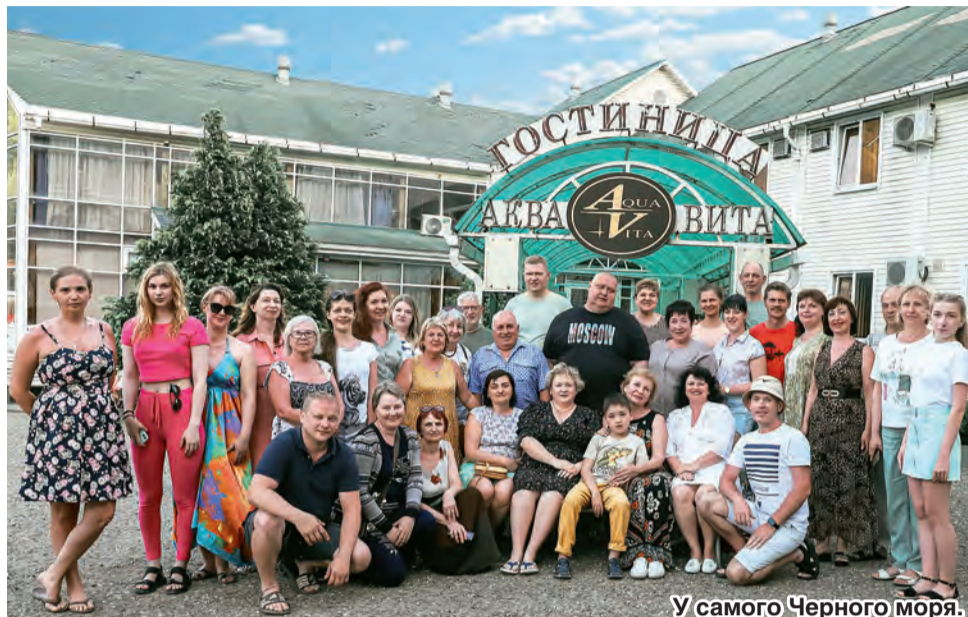
У самого Черного моря.

В этом году, 11-13 июня, гостеприимные работники отеля радушно, как добрых и желанных друзей, принимали нашу огромную группу, состоящую из 150 человек. Нам были предоставлены комфортабельные номера с отличным сервисным обслуживанием, открытый бассейн, детская игровая площадка, чистая и красивая территория, хороший ресторан с разнообразным ассортиментом блюд. Но, конечно, главным действующим лицом на этом празднике жизни стало море – чистое, спокойное, уже комфортное для купания, удивлявшее нас все три дня изумительной палитрой красок. Дни на мореместили пляжный отдых и семейный досуг, теплые дружеские беседы и песни под гитару в лучах заката, тихое наслаждение покоем под нежное шуршание морского прибоя. Для желающих была организована фотосессия