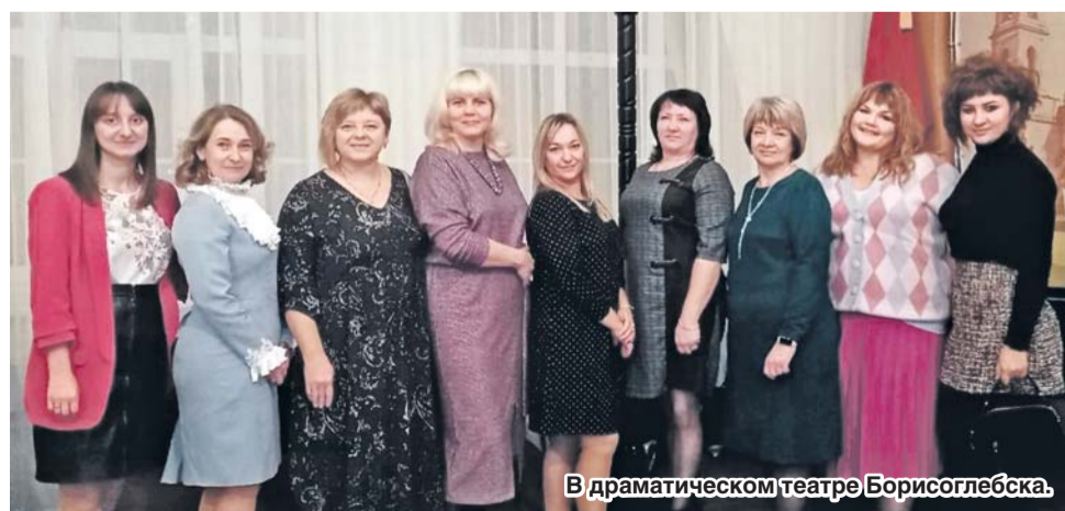
В драматическом театре Борисоглебска.

Надеюсь, что культпоход в театр послужит началом новой традиции в нашей профсоюзной организации.