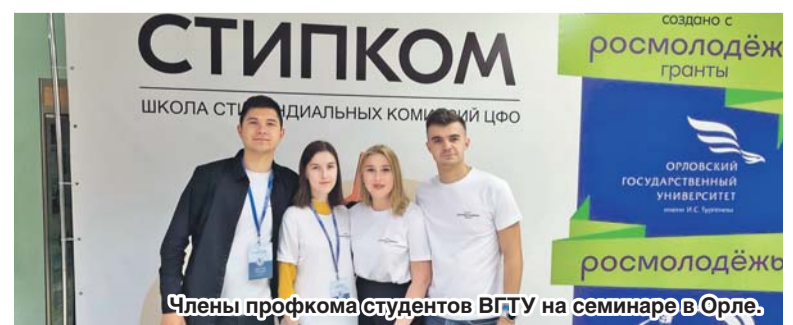
Члены профкома студентов ВГТУ на семинаре в Орле.

Теперь все полученные знания мы сможем применить в нашей профсоюзной работе.