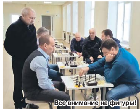
Все внимание на фигуры!