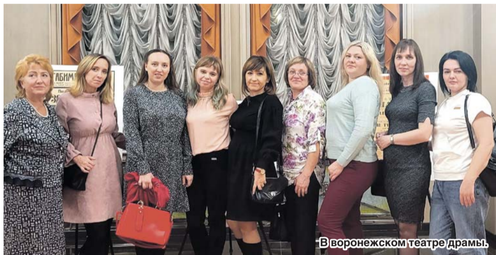
В воронежском театре драмы.

«Первичку» за стопроцентный результат наградили поездкой на лирическую комедию