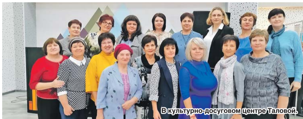
В культурно-досуговом центре Таловой.

Таловский райком профсоюза уже не один год тесно сотрудничает с филармонией. Ведь такие культурно-массовые мероприятия не только дарят хорошее настроение, но и предупреждают эмоциональное выгорание педагогов.