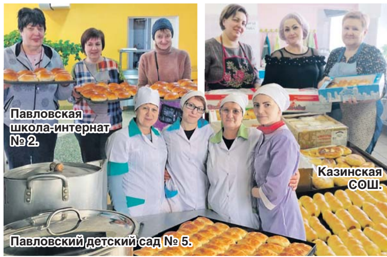
Павловская школа-интернат № 2.