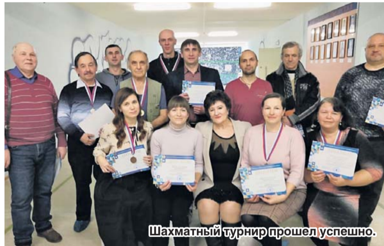
Шахматный турнир прошел успешно.

Впереди – областной этап соревнований, организуемых Воронежским обкомом профсоюза образования. Аннинские игроки ждут его с большим нетерпением!