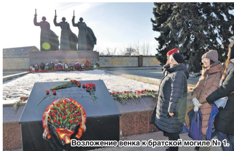
Возложение венка к братской могиле № 1.

Существенные изменения коснутся правил оформления рекламной продукции. Сегодня, несмотря на законодательное требование обязательно использовать в рекламе государственный язык, слова на вывесках, написанные латиницей, как правило, вытесняют русскоязычные. По новому закону, тексты на русском и других языках «должны быть идентичными по содержанию, равнозначными по размещению и техническому оформлению (иметь одинаковые параметры – цвет, тип и размер шрифта)».