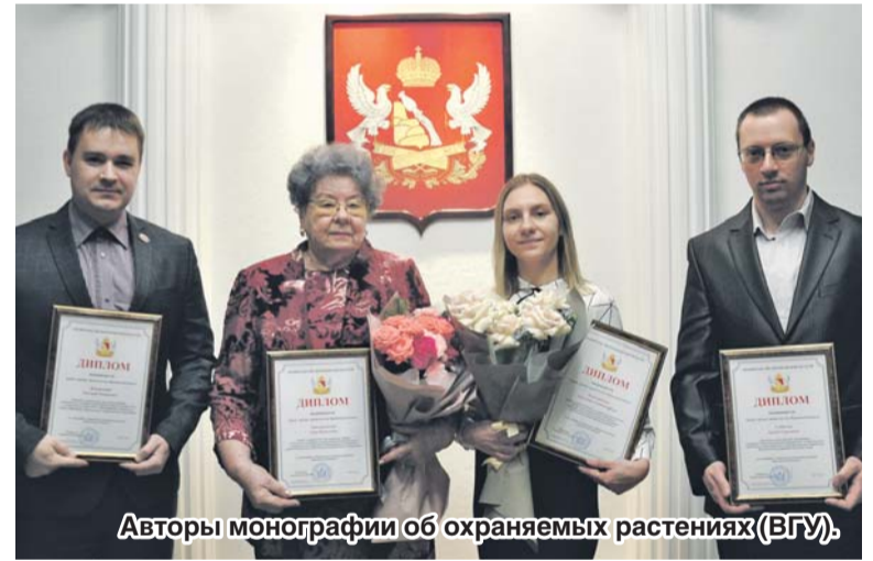
Авторы монографии об охраняемых растениях (ВГУ).