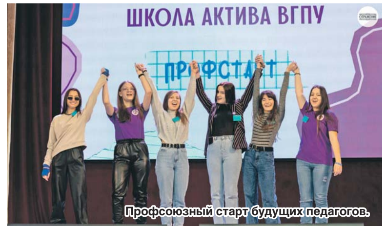
Профсоюзный старт будущих педагогов.

«...Было круто то, что правовые вопросы нам объясняли не скучным юридическим языком, а с са-моотдачей!»