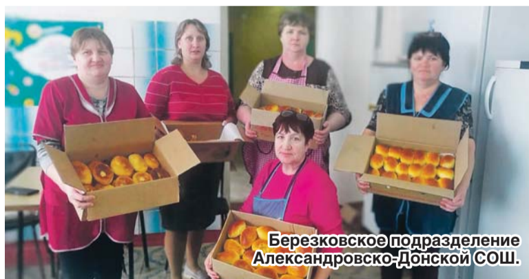
Березковское подразделение Александровско-Донской СОШ.