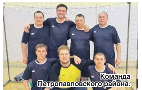
Команда Петропавловского района.

Зональный этап турнира по мини-футболу в Павловске прошел 17 марта – поведала нашей газете председатель Павловской районной организации Общероссийского