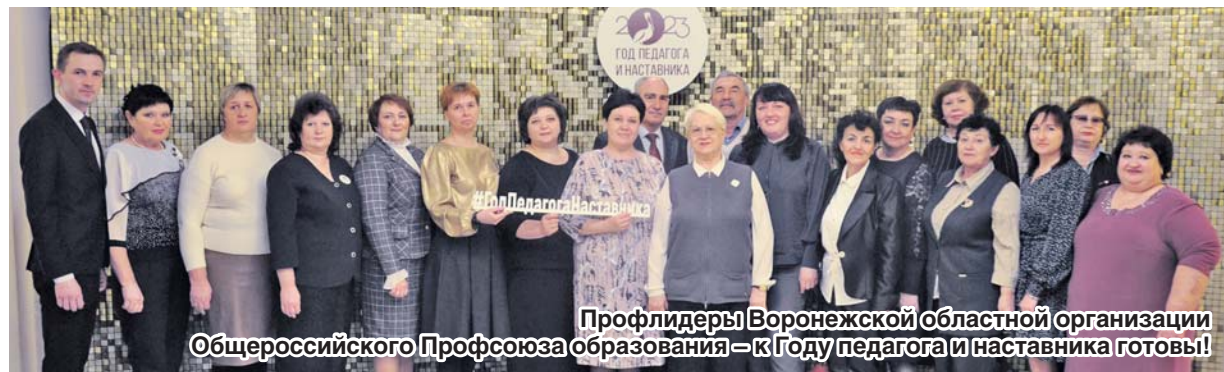
Профлидеры Воронежской областной организации Общероссийского Профсоюза образования – к Году педагога и наставника готовы!