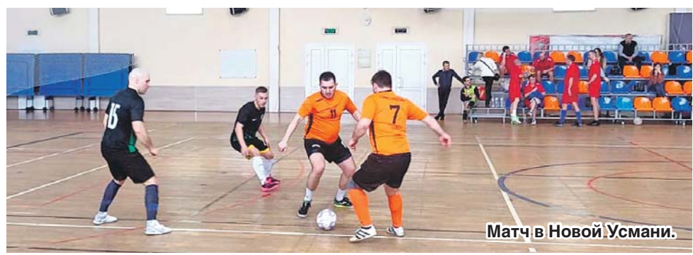
Матч в Новой Усмани.

По информации председателя Новоусманской районной организации Обще-