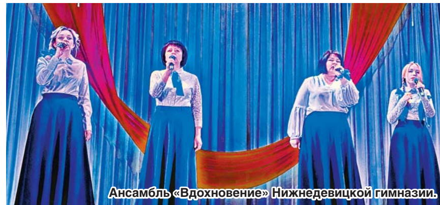
Ансамбль «Вдохновение» Нижнедевицкой гимназии.