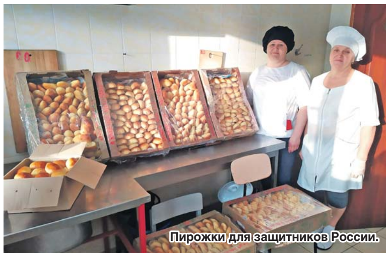
Пирожки для защитников России.

В Острогожском районе Девицкая основная школа является базовой площадкой районного во-