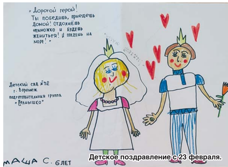
Детское поздравление с 23 февраля.

В марте Лихачев вручил воинам приобретенный на собранные средства автомобиль, загруженный гуманитарной помощью.