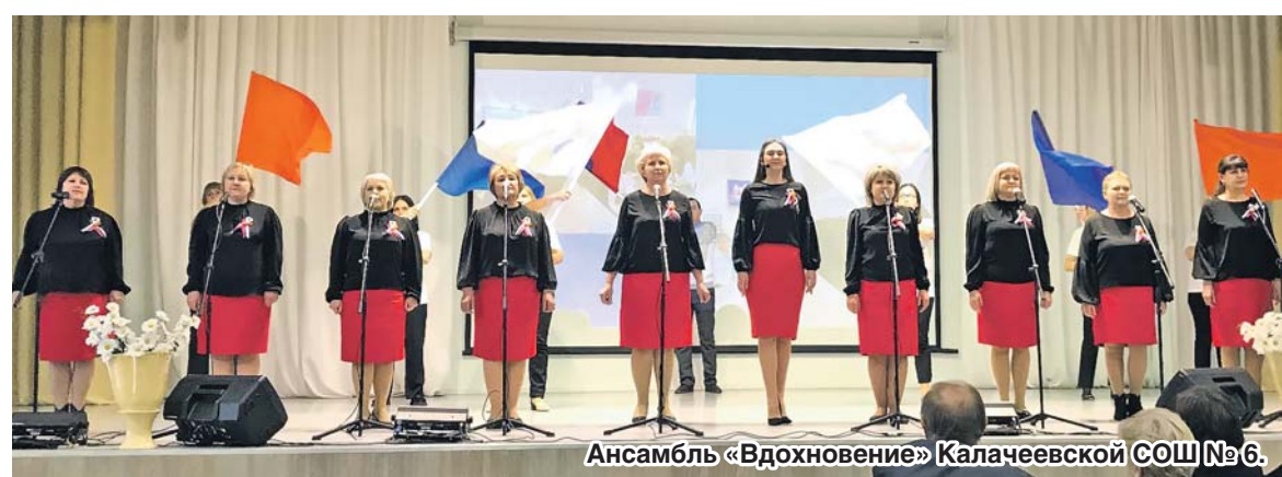
Ансамбль «Вдохновение» Калачеевской СОШ № 6.