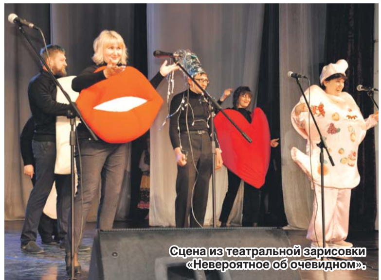
Сцена из театральной зарисовки «Невероятное об очевидном».