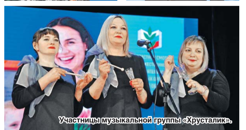
Участницы музыкальной группы «Хрусталик».

зрелищностью, но и большим разнообразием.