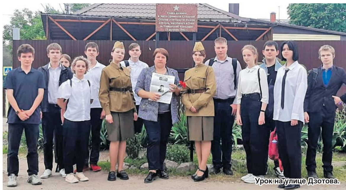
Урок на улице Дзотова.