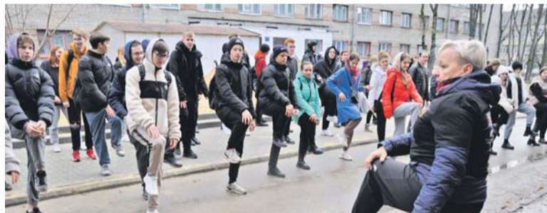
На зарядку становись!

тивной работе профкома и лично председателя профсоюзной организации обучающихся ВГТУ Рома-