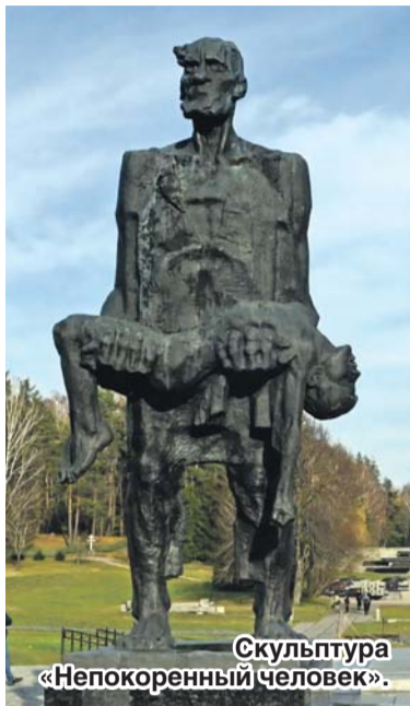
Скульптура «Непокоренный человек».

Воронежцы, посетившие мемориальный комплекс «Хатынь», испытали сильное потрясение