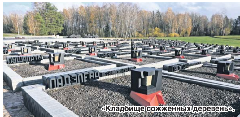
«Кладбище сожженных деревень».

ственной войны гитлеровцами была сожжена деревня вместе со всеми жителями. Самое ужасное, что она стала лишь одной из 186 других белорусских деревень, сожженных