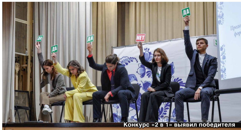
Конкурс «2 в 1» выявил победителя

– Я провела мастер-класс, или, скорее, диалог на равных, с профлидерами воронежского студенчества. Мы говорили о психологических аспектах работы профгруппоргов, правилах поведения в кризисной ситуации. Профсоюз – это большая семья, в которой все делятся своим опытом. Мы рассказывали истории из своей жизни,