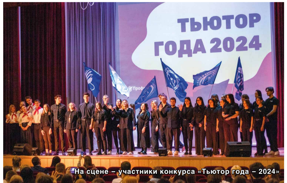
На сцене – участники конкурса «Тьютор года – 2024»

дая команда подготовила проект: обозначила его актуальность и социальную значимость, составила календарный план и смету, описала целевую аудиторию. В «Визитной карточке» команды рассказали об особенностях своей работы, в том числе профсоюзной. Конкурс на проверку сплоченности команды назывался «Крокодил». Здесь представители каждого факультета дали по 20 слов или словосочетаний, он должен был обыграть их так, чтобы его