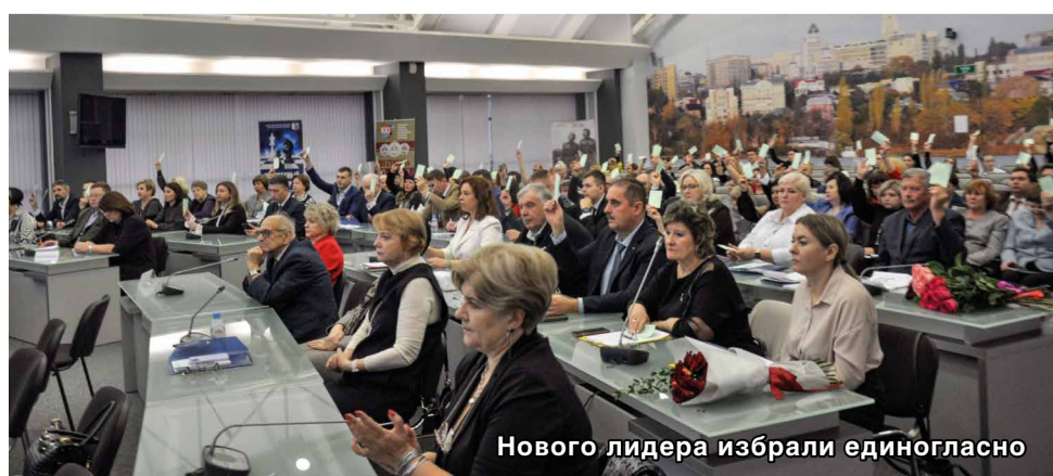
Нового лидера избрали единогласно

Ключевой задачей остается повышение профессионального уровня профсоюзных кадров. Сегодня профсоюзный лидер должен быть не менее компетентным, чем его социальный партнер – руководитель образовательной организации или руководитель районного управления образования. Чтобы отстаивать права членов Профсоюза, необходимо на высоком уровне владеть трудовым законодательством. При этом обязательно необходимо готовить кадровый резерв, обучать его. Так, месяц назад областная организация