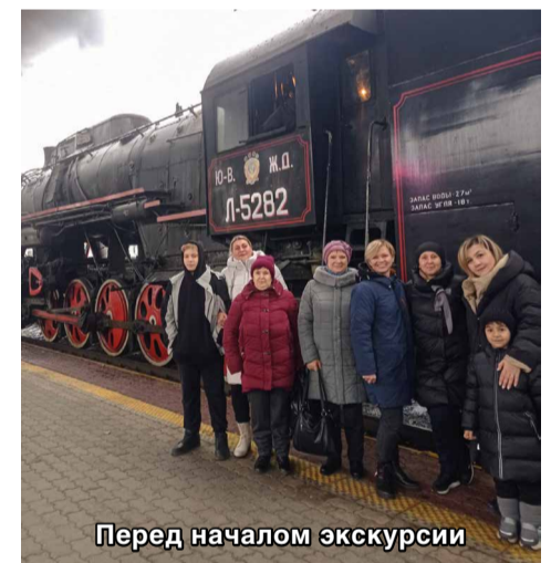
Перед началом экскурсии

После концерта мы гуляли по парку, который представляет собой целостный ландшафтно-архитектурный памятник. Примечательно, что садово-парковое искусство в рамонском имении отражало в себе соответствующие концу XIX века садовые традиции России, а именно часто наблюдаемое смешение парковых стилей: регулярного и пейзажного. В 2013 году по проекту французского ландшафтного архи-