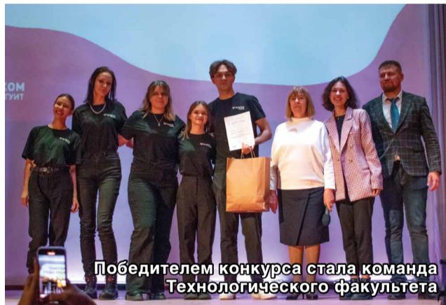
Победителем конкурса стала команда Технологического факультета

команда сразу угадала, о чем идет речь. Суть «Биатлона» заключалась в проверке конкурсантов на знание локальных нормативных актов, федерального законодательства в сфере высшего образования, истории вуза.